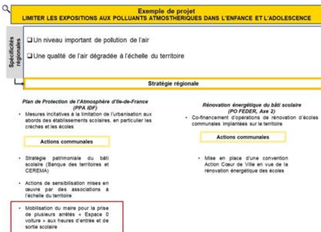
Figure 2 Un exemple permettant d'illustrer la plus-value de l'appel à projets

Dans l'exemple retenu, on constate que la commune dispose d'une vision stratégique, qui procède notamment d'une déclinaison des priorités et des besoins identifiés à l'échelle régionale (à partir d'éléments de diagnostic régional). La commune a mobilisé divers leviers d'actions pour structurer une politique environnementale ciblant les écoles et leurs abords.